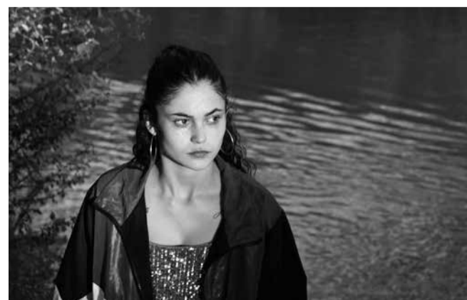
«El Agua» de Elena López Riera