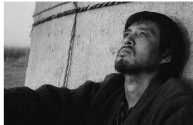
«Poet» de Darezhan Omirbayev