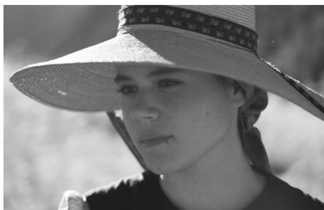
«Foudre» de Carmen Jaquier