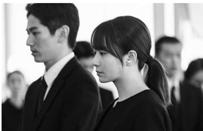
«Love Life» de Kōji Fukada