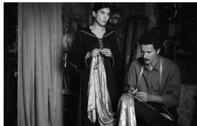
«Le Bleu du caftan» de Maryam Touzani

ONNA BAKARI NO YORU, Japon, 1961, couleur, 1h33