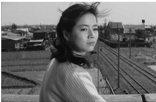
«La Nuit des femmes» de Kinuyo Tanaka

Auteur de purs chefs-d'œuvre comme «La nuit nous appartient», «Two Lovers», «The Lost City of Z» ou encore «Ad Astra», James Gray est l'un de nos plus grands cinéastes actuels. Avec «Armageddon Time», où il revient sur son enfance, le cinéaste new-yorkais nous adresse un