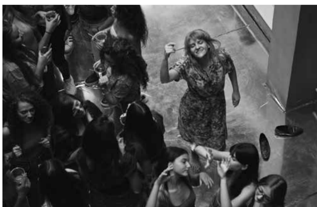
«The Happiest Man in the World» de Teona Strugar Mitevska