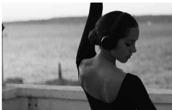
«Houria» de Mounia Meddour