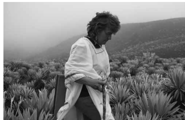
«Hijos del viento» de Felipe Monroy