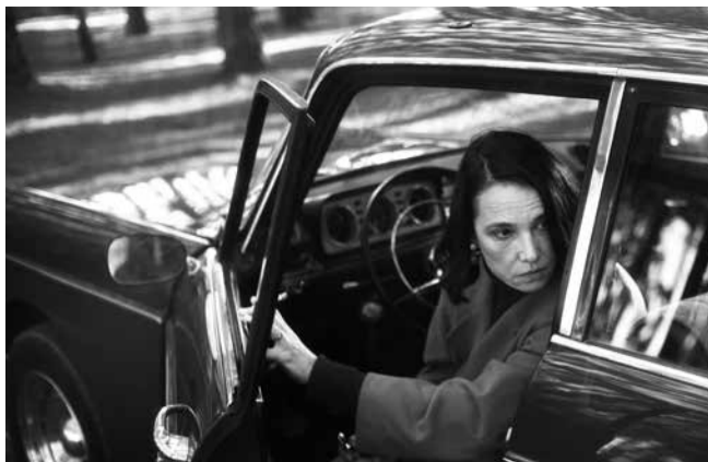
«1976» de Manuela Martelli

Suisse / Colombie / France, 2022, couleur, 1h38