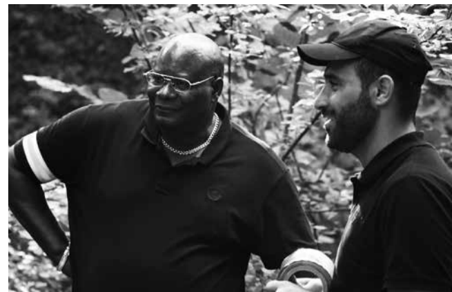
«L'Îlot» de Tizian Büchi

Taeko vit avec son mari Jiro et son fils Keita, issu d'une précédente relation, dans un appartement situé en face de celui de ses beaux-parents qui n'ont jamais véritablement accepté cette famille recomposée. A la suite d'un incident, le père biologique de Keita refait surface, en même temps que l'ancienne fiancée de Jiro... Fer de