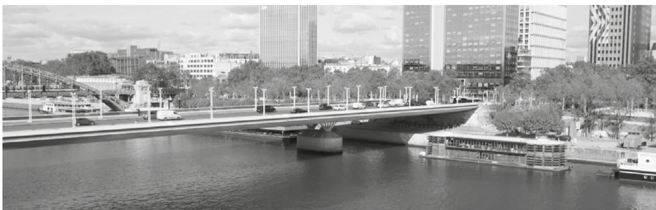
«Sur l'Adamant» de Nicolas Philibert