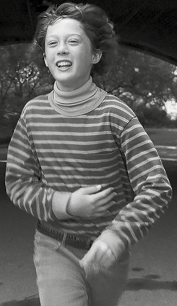
«Armageddon Time» de James Gray