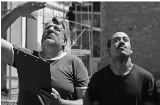
«6 Jours à Barcelone» de Neus Ballús

Door», la réalisatrice sud-coréenne July Jung est de retour avec un nouveau long-métrage d'une délicatesse rare, porté par une mise en scène lumineuse et deux actrices époustouflantes. Inspiré d'un fait divers, le film dénonce avec brio les effets pervers et dévastateurs du capitalisme 4.0 sur une jeunesse délaissée.