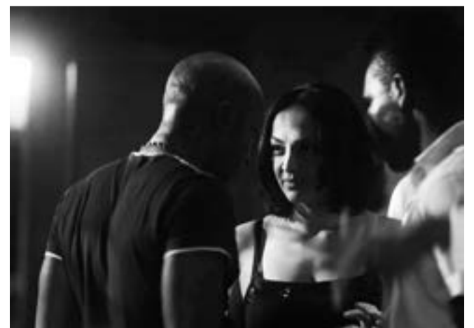
«Drop of Sun» de Elene Naveriani