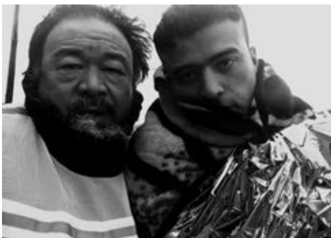
«Human Flow» de Ai Weiwei