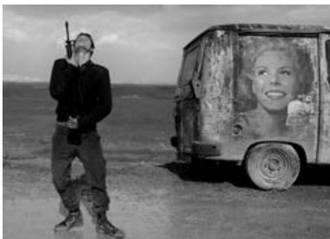
«Foxtrot» de Samuel Maoz