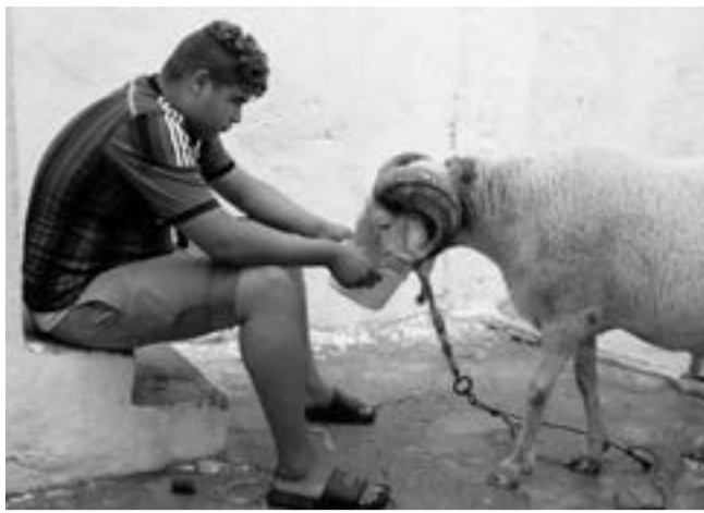
«Des moutons et des hommes» de Karim Sayad

Guérisseuse et sage-femme de la communauté Sindhi, Nooran apprend de sa grand-mère l'art ancestral des chants qui soignent les piqûres de scorpion. Aadam, un marchand de dromadaires