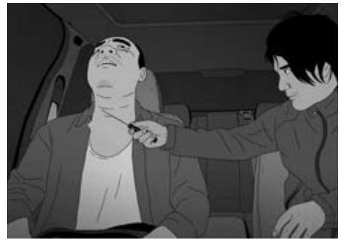
«Have a Nice Day» de Jian Liu

I AM TRULY A DROP OF SUN ON EARTH, Suisse / Géorgie, 2017, noir et blanc, 1h01