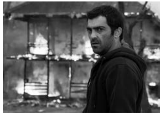
«Un Homme intègre» de Mohammad Rasoulof

bâtiment labyrinthique, des hommes et des enfants travaillent des heures durant, les mains plongées dans des produits toxiques, faisant défiler des kilomètres de tissus, dormant et mangeant sur place. En totale immersion dans cet univers inimaginable fait de bruits métalliques et de vapeurs, le cinéaste restitue de façon saisissante un labeur inhumain, tout en décrivant les enjeux universels de la condition ouvrière .