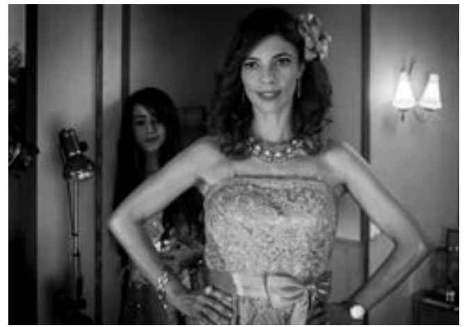
«Abracadabra» de Pablo Berger