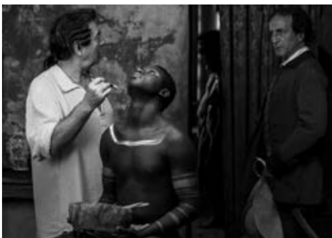
«Zama» de Lucrecia Martel