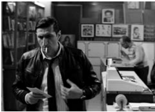
«Le Caire confidentiel» de Tarik Saleh