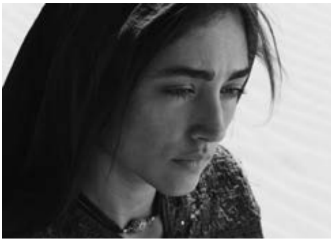
«Le Chant des scorpions» de Anup Singh