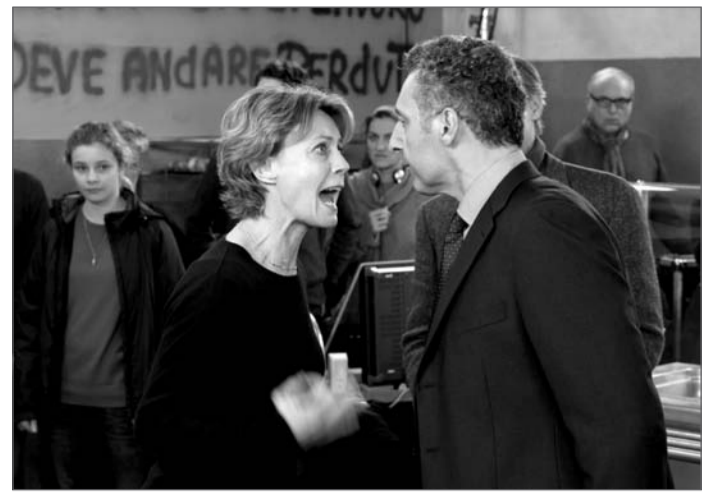
«Mia madre» de Nanni Moretti