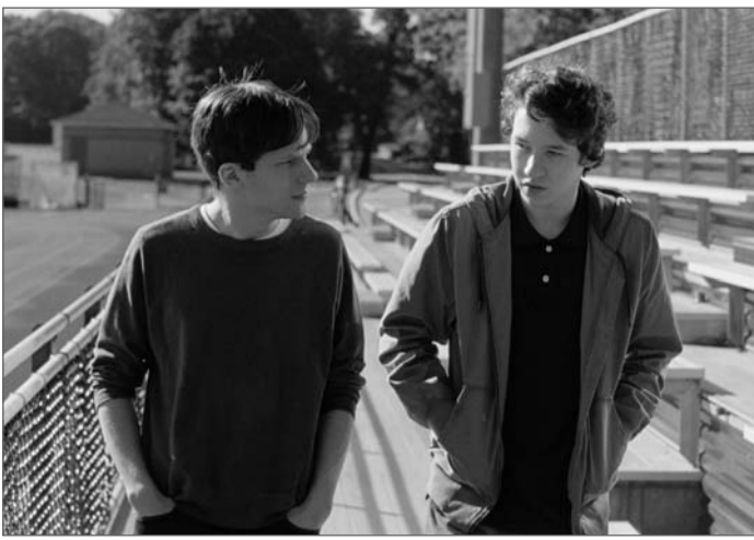
«Plus fort que les bombes» de Joachim Trier